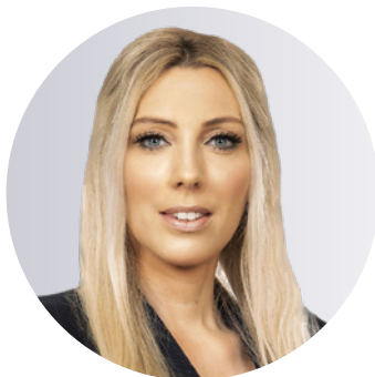
Autorin: Annika Knoke

Unter den großen Verwahrstellen ist die DZ BANK-Gruppe der einzige deutsche Anbieter mit insgesamt 439 Mrd. Euro (Stand Ende März 2021) an verwahrten Vermögenswerten in Fonds.