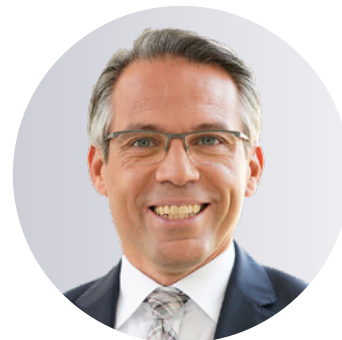
Autor: Stefan Adam

Senior Managerin Business Development DZ PRIVATBANK